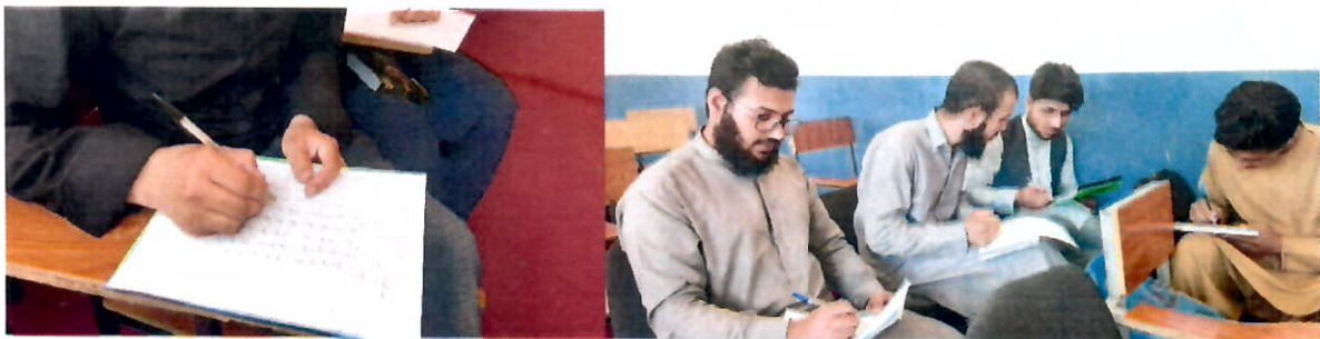
تصاویر بالا جریان ارزیابی اصلاحی از کیفیت تدریس در پوهنچی ها را نشان می دهند

● به اساس طرز العمل ارزیابی اصلاحی از کیفیت تدریس در ماه میزان سال ۱۴۰۲ نوع سوم ارزیابی اصلاحی از کیفیت تدریس به سطح نهاد طبق تقسیم اوقات منظم توسط آمریت ارتقای کیفیت و کمیته اصلی ارتقای کیفیت برنامه ریزی شده و طی (۴) روز کاری به اساس یک چک لیست، استادان (۹) پوهنچی توسط محصلین مورد ارزیابی قرار گرفته نتیجه آن تحلیل و جهت رفع نواقص و کاستی ها، نقاط قوت و ضعف به تمام پوهنچی ها رسماً خبر داده شده است.