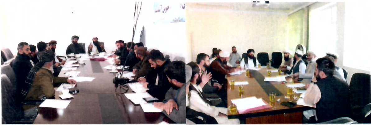
تصاویر بالا جریان برگزاری جلسات کمیته اصلی ارتقای کیفیت را نشان می دهد

● طی سال تحصیلی ۱۴۰۲ (۳) ورکشاپ رسمی آگهی دهی از چارچوب جدید ارتقای کیفیت و اعتباردهی به تاریخ ۱۴۰۲/۷/۱۲، مرور دوره ای برنامه های علمی به تاریخ ۱۴۰۲/۹/۶ و تشریح عملی رهنمود پلان استراتژیک به تاریخ ۱۴۰۲/۱۱/۲۳ از طرف آمریت ارتقای کیفیت برای رؤسای پوهنچی ها و آمرین دیپارتمنت ها، برنامه ریزی شده و رسماً برگزار گردیده است. اسناد آن حفظ دوسیه مخصوص می باشد؛ همچنان در جریان بازدید از فعالیت های کمیته های فرعی تضمین کیفیت پوهنچی ها، برای مسئولان راهنمایی های لازم شفاهی نیز ارایه گردیده است.