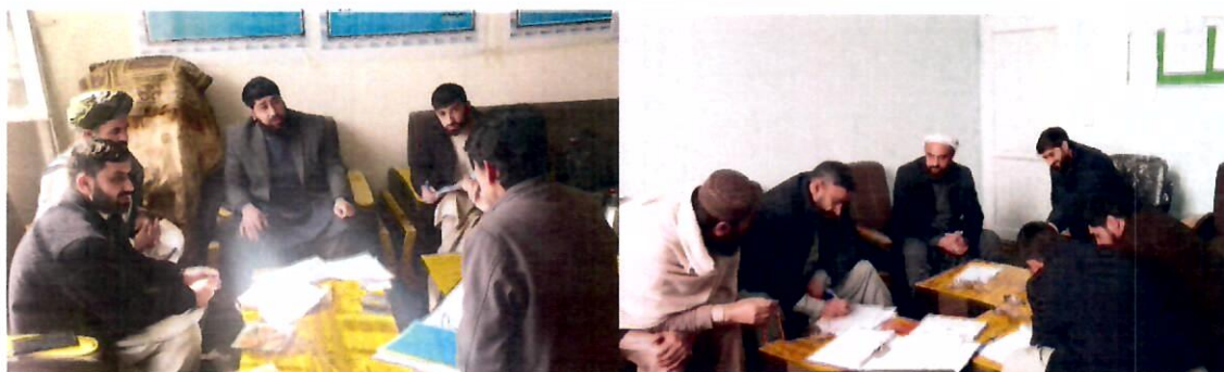
تصاویر بالا جریان ارزیابی خودی آزمایشی مرحله سوم دیپارتمنت ها را نشان می دهد

قرار گرفته که نتایج آن تحت تحلیل و بررسی قرار دارد و قرار است نتایج بعد از تحلیل جهت رفع نواقص و کمی ها و آماده شدن دیپارتمنت ها به مرحله سوم اعتباردهی، رسماً به آنها فیدبک داده شود.