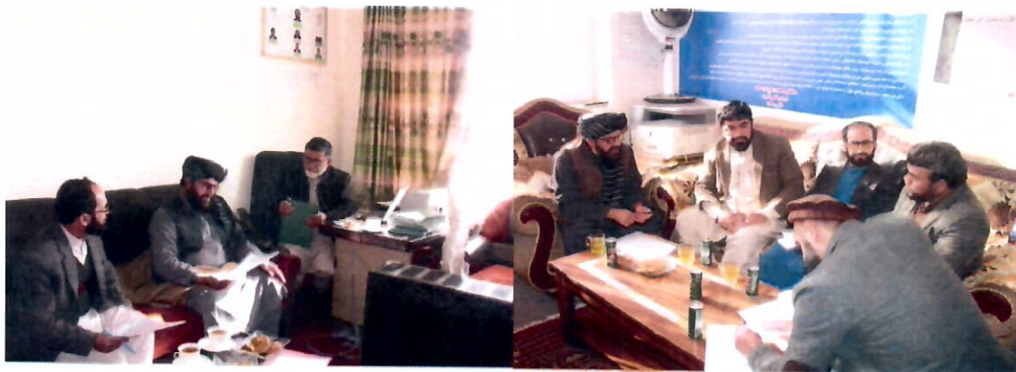
تصاویر بالا جریان مرور دوره ای دیپارتمنت ها را توسط هیئت مؤلف نشان می دهد