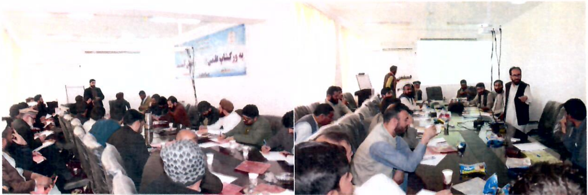
تصاویر بالا جریان برگزاری ورکشاپ های آگاهی دهی از برنامه های تضمین کیفیت را نشان می دهد

● طی سال تحصیلی ۱۴۰۲ (۳) ورکشاپ رسمی آگهی دهی از چارچوب جدید ارتقای کیفیت و اعتباردهی به تاریخ ۱۴۰۲/۷/۱۲، مرور دوره ای برنامه های علمی به تاریخ ۱۴۰۲/۹/۶ و تشریح عملی رهنمود پلان استراتژیک به تاریخ ۱۴۰۲/۱۱/۲۳ از طرف آمریت ارتقای کیفیت برای رؤسای پوهنچی ها و آمرین دیپارتمنت ها، برنامه ریزی شده و رسماً برگزار گردیده است. اسناد آن حفظ دوسیه مخصوص می باشد؛ همچنان در جریان بازدید از فعالیت های کمیته های فرعی تضمین کیفیت پوهنچی ها، برای مسئولان راهنمایی های لازم شفاهی نیز ارایه گردیده است.